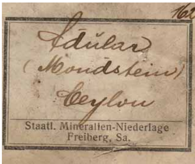
▲ Originalna etiketa iz 1835. godine.