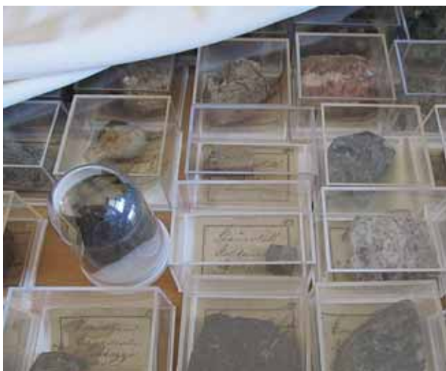
▲ Sistematski sređeni uzorci sačuvane Herderove zbirke danas se čuvaju na propisan način.

Herder je na svom putu sakupio poveću zbirku ruda i kamenja, od kojih je jedan deo ostavio Knezu Milošu, a drugi odneo u Frajberg (Žujović, 1893). Ovako uvećana geološka zbirka bila je smeštena u posebnoj sobi kragujevačkog „konačića” u okviru Muzeuma kragujevačkog. Knez Miloš je brižljivo čuvao minerale koje je dobio od Herdera, čiji trud je nagradio sa 1 000 dukata i specijalno iskovanom sabljom, ukrašenom briljantima.